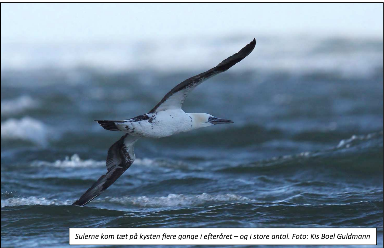
Sulerne kom tæt på kysten flere gange i efteråret – og i store antal.

Som nævnt under ringmærkningen var der flere perioder, hvor vejret ikke var gunstigt for trækkende fugle ved Blåvand. Det betød, at visse arter kom til at optræde i noget mindre omfang end normalt. Især september, som normalt er en god måned for havfugle, svigtede på denne måde. Men heldigvis kom der gang i noget af det, som Blåvand er kendt for, i sidste halvdel af oktober samt i november. Efter nogle år hvor det ikke er blevet til særligt mange Store Stormsvaler, kunne denne sæson byde på i alt 36 fugle, hvoraf de 20 blev set den 25. oktober. Det er det største antal på én dag siden 2004. Den endnu mere sjældne Lille Stormsvaler blev også set, da hele tre eksemplarer lagde vejen forbi med henholdsvis en i oktober og to i november. Blandt de større havfugle har Sule haft et fantastisk efterår, og således blev der registreret næsten 12.000 fugle. Blandt de mange Sortænder - som jo er et af stedets "varemærker" - dukkede gamle kendinge op i oktober, da de formentligt selvsamme individer af Amerikansk Fløjlsand, Amerikansk Sortand og Brilleand (to stykker) fra tidligere år atter valgte at tilbringe vinteren herude.