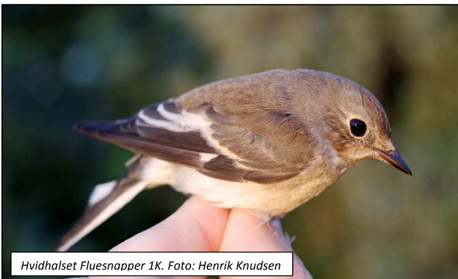
Hvidhalset Fluesnapper 1K.

Oktober var fuldstændig anderledes. Det blev en ekstrem tør periode med ganske få dage med kraftig vind, og der var kun en enkelt dag, hvor der ikke kunne arbejdes med ringmærkning. I forhold til gennemsnittet i perioden 2010-2014 for oktober på 1.568, lå oktober 2015 i den høje ende med 2.372 fugle. Det skyldtes især tre fantastiske dage: Den 11. oktober med 215 fugle, den 17. oktober med 472 fugle og den 18. oktober med 339. Samlet stod de tre dage således for 1.026 ringmærkede fugle.