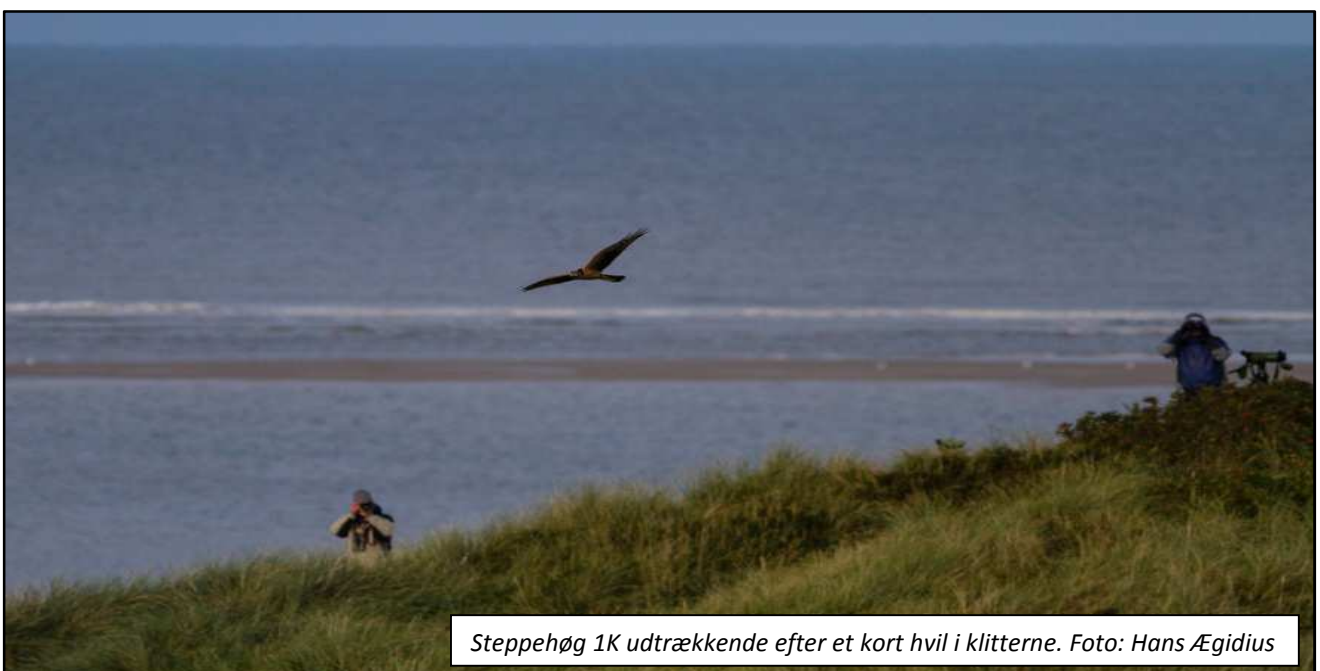
Steppehøg 1K udtrækkende efter et kort hvil i klitterne.