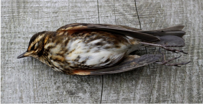
"Islandsk Vindrossel" 2k+

Læg mærke til den meget mørke flanke, samt den kraftige mørkning på bagerste del af flanken.